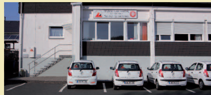
Unser Standort in Herborn-Seelbach