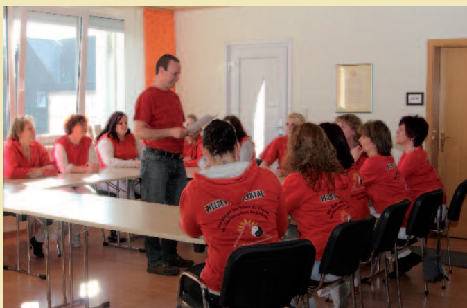
Interne Fortbildungen und Schulungsmaßnahmen sind für uns selbstverständlich und werden regelmäßig durchgeführt.

Vom Pflegeteam Aartal in Herborn-Seelbach werden schon seit 2005 die Ihnen bekannten allgemeinen Leistungen in der Kranken- und Altenpflege wie z.B. Körperpflege und die medizinische Behandlungspflege jeglicher Art durchgeführt. Von erfahrenen Pflegefachkräften werden hilfebedürftige und kranke Menschen sowie deren Familienangehörige optimal betreut und versorgt.